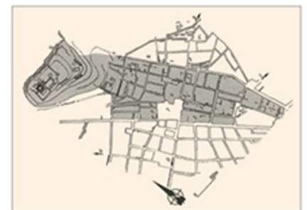
Afbeelding: plattegrond van Cuzco